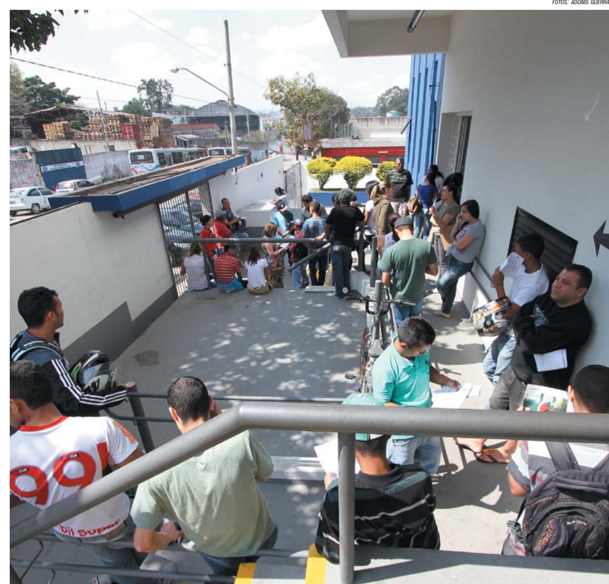
Interessados formaram fila para se inscrever nos cursos do IFSP

Segundo Rafael, as bolsas-auxílio são custeadas por meio de emenda parlamentar do deputado federal Vicente Candido, do PT de São Paulo.